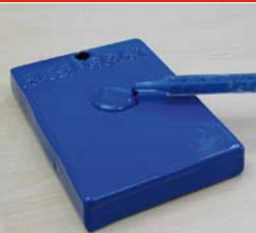
RESICOAT® RS 2K Reparaturmaterial